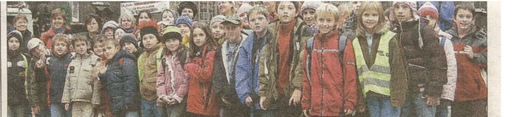
Vor dem Haupttor des weltberühmten Wiener Stephansdomes posierten die Schüler der Volksschule Würfelfach für die Dokumentationsfotos zur absolvierten Exkursion.

Adventfeier. Die Gemeindeführung und die Ortsvereine laden am Freitag, 22. Dezember, ab 17 Uhr wieder zur besinnlichen Adventfeier beim Mühlrad (visavis Postamt) ein.