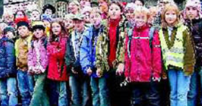
Vor dem Haupttor des weltberühmten Wiener Stephansdomes posierten die Schüler der Volksschule Würfelfach für die Dokumentationsfotos zur absolvierten Exkursion.